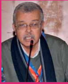
Pr Kamel Bouzid *